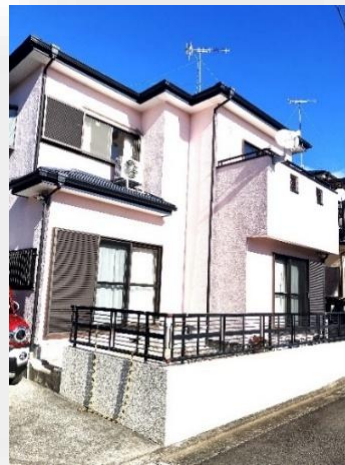
◆お庭スペースあります◆