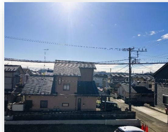
◆2階からの眺望良好◆